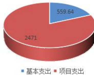
(图 2: 支出预算结构图) (饼状图)

自贡恐龙博物馆 2022 年支出预算 3030.64 万元，其中：基本支出 559.64 万元，占 18.47%；项目支出 2471.00 万元，占 81.53%。