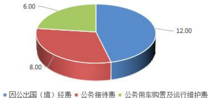
(图6：“三公”经费财政拨款支出结构)(饼状图)

自贡恐龙博物馆2022年“三公”经费财政拨款预算数26.00万元，较2021年预算持平，其中：因公出国(境)经费12.00万元，公务接待费8.00万元，公务用车购置及运行维护费6.00万元(公务用车购置费0万元、公务用车运行费6.00万元)。