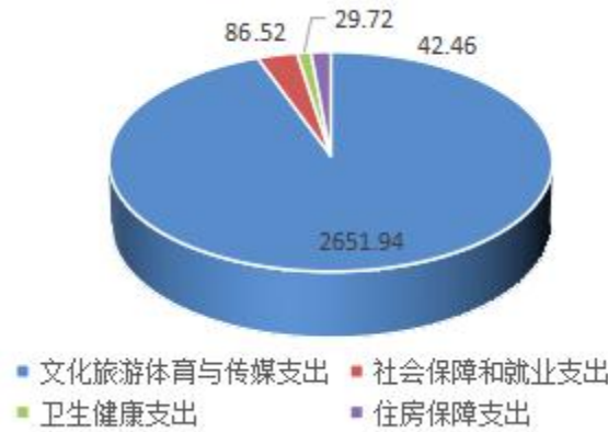
（图 5：一般公共预算财政拨款支出预算结构）（饼状图）

文化旅游体育与传媒支出 2651.94 万元，占 94.35%；社会保障和就业支出 86.52 万元，占 3.08%；卫生健康支出 29.72 万元，占 1.06%；住房保障支出 42.46 万元，占 1.51%。