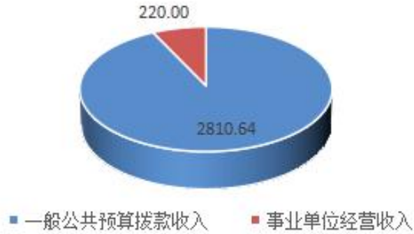
(图 1: 收入预算结构图) (饼状图)